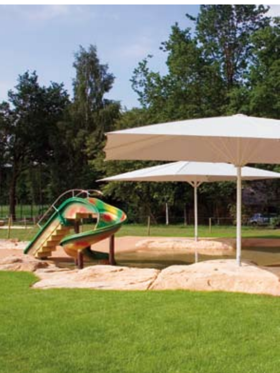
Der Kleinkinderbereich im Naturerlebnisbad Lastrup

Dr. Klaus-Jürgen Winter, Neu-Eichenberg