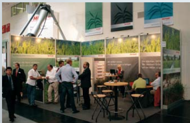
EKO-PLANT auf der IFAT ENTSORGA 2010

Zum Zeitpunkt der Drucklegung standen die genauen Veranstaltungstermine leider noch nicht fest. Wir werden Sie rechtzeitig informieren. Die Möglichkeit zur Anmeldung gibt es bei Ute Bachmann, Tel.: +49 5542 9361-61.