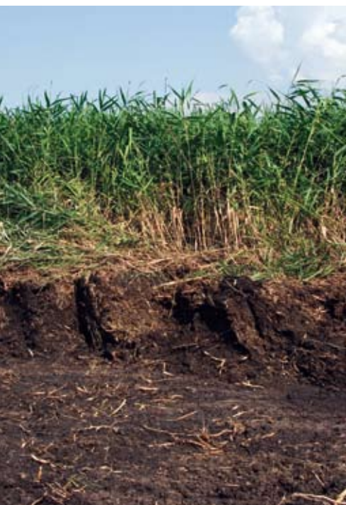
Klärschlammerte aus Schilfbeeten - wertvoller Dünger zur Humusproduktion

Dipl.-Ing. Ralf Gottschall, Neu-Eichenberg