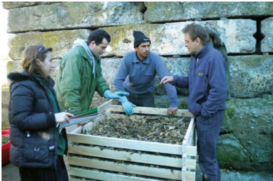
Unterschiedliche Herkunft - gemeinsames Forschen: Die Kompostierung biogener Abfallstoffe erschließt regionale Nährstoffkreisläufe und trägt so zum Umweltschutz in Georgien bei.

Seit fünf Jahren unterstützt die EKO-PLANT GmbH zusammen mit ihrer Tochterfirma Humus und Erden Kontor GmbH die Einrichtung eines Lehrstuhls für Ökologischen Landbau und Naturschutz an der Agraruniversität von Tiflis, Georgien. Das kleine Land mit rund 4,5 Millionen Einwohnern liegt in Vorderasien und ist ungefähr so groß wie Bayern. Im Süden grenzt es an Armenien und Aserbaidschan, zusammen bilden diese drei Länder einen Teil der Region des Südkaukasus.