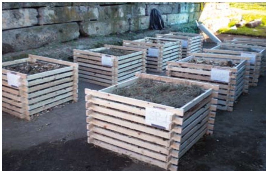
Versuchsanlage zur Kompostgewinnung am Lehrstuhl für Ökologischen Landbau und Naturschutz an der Agraruniversität in Tiflis, Georgien