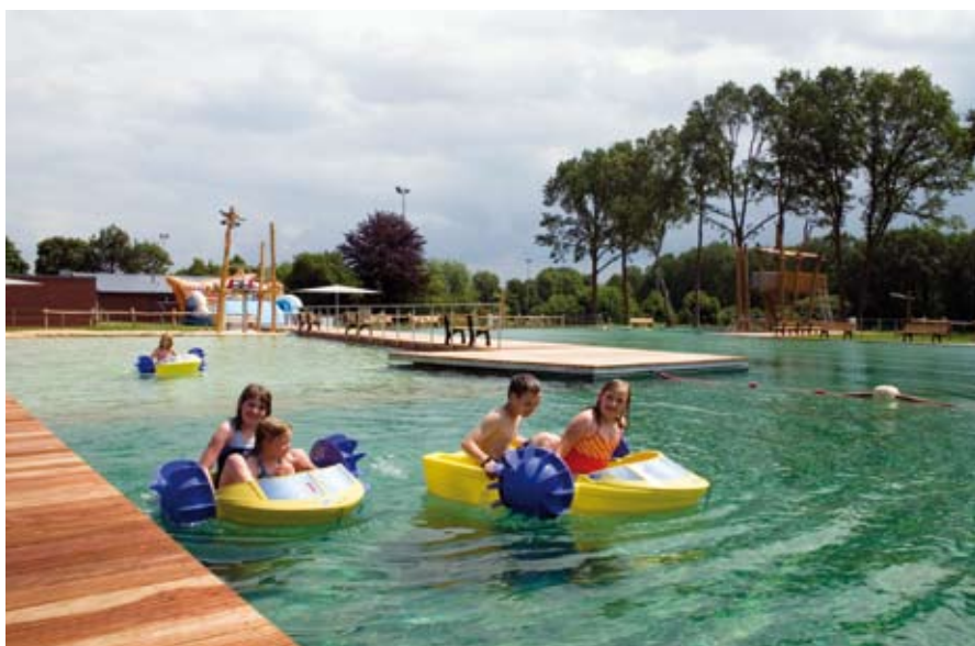
Lustiges Bootfahren am Eröffnungstag des Naturerlebnisbades Lastrup

Ähnliches gibt es vom Naturfreibad in Heringen zu berichten. Dieses eröffnete aufgrund der „Großbaustelle Hallenbad“ erst am 4. Juli 2010 seine Pforten für die Besucher. Während in Lastrup der Umkleidetrakt nur energetisch saniert und in diesem Zuge auch der Eingangsbereich erneuert wurde, erfolgt in Heringen ein kompletter Neubau des Hallenbades mit Umkleide- und Eingangsgebäude. Dieser Teil des zukünftigen Ganzjahresbades wird erst Ende 2010 feierlich eröffnet, so