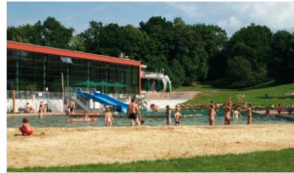
Strandleben vor der Haustür - im Naturerlebnisbad in Heringen an der Werra

In beiden Freibädern ging diese Rechnung gemessen an den Besucherzahlen schon im ersten Jahr gründlich auf. Das Freibad in Lastrup eröffnete nach dem langen und schneereichen Winter am 12. Juni 2010 seine Pforten und schloss diese am 31. eines kalten und verregneten