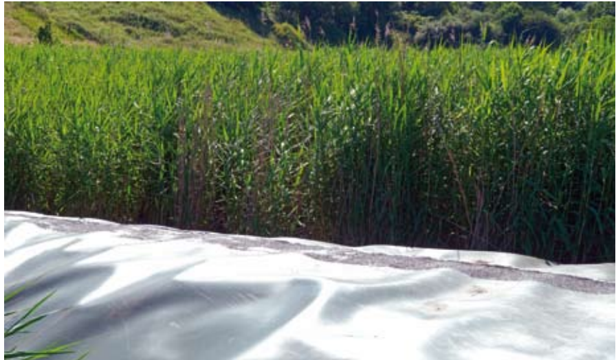
Schilf einer Klärschlammvererdungsanlage im Sonnenlicht - Assimilation und Umwandlung von CO 2 in Pflanzenmaterial und stabile humose Substanzen durch Photosynthese

Die Projizierung der CO 2 -Aufnahmekapazität des Schilfes aus der obenstehenden Berechnung der Klärschlammvererdungsanlage auf die Bodenfilterfläche dieses Beispielbades ergibt eine jährliche Aufnahmemenge von 30 Tonnen an CO 2 .