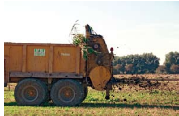
Landwirtschaftliche Verwertung von Klärschlammerte - ein Beitrag zur Humusproduktion

Die Gründe für die Abnahme der Humusversorgung von Ackerflächen in Deutschland liegen somit einerseits in dem vermehrten Anbau humuszehrender Kulturen wie Getreide, Silomais (Biogasanlagen!), Zuckerrüben und Kartoffeln, während humusmehrende Pflanzen wie Ackergras, Klee, Luzerne und Körnerleguminosen immer seltener auf den Feldern wachsen und Stilllegungsflächen insgesamt zurückgehen. Andererseits können die durch den Klimawandel verursachten Schwankungen in der Umgebungstemperatur und Änderungen der Bodenwassergehalte den Humusvorrat im Boden negativ beeinflussen.