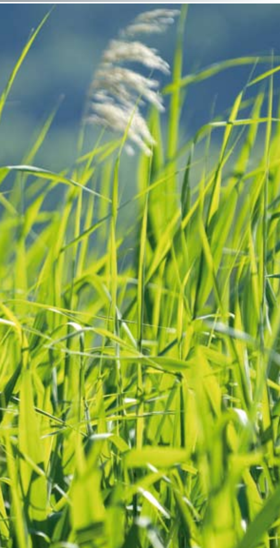
Unsere Schilfpflanzen: „Spezialanfertigungen“

EKO-PLANT hilft Georgien - Umweltschutz im Kaukasus