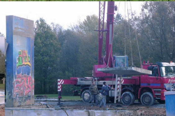
Das Freibad in Immenreuth im alten Zustand - und der Beginn der Bauarbeiten.