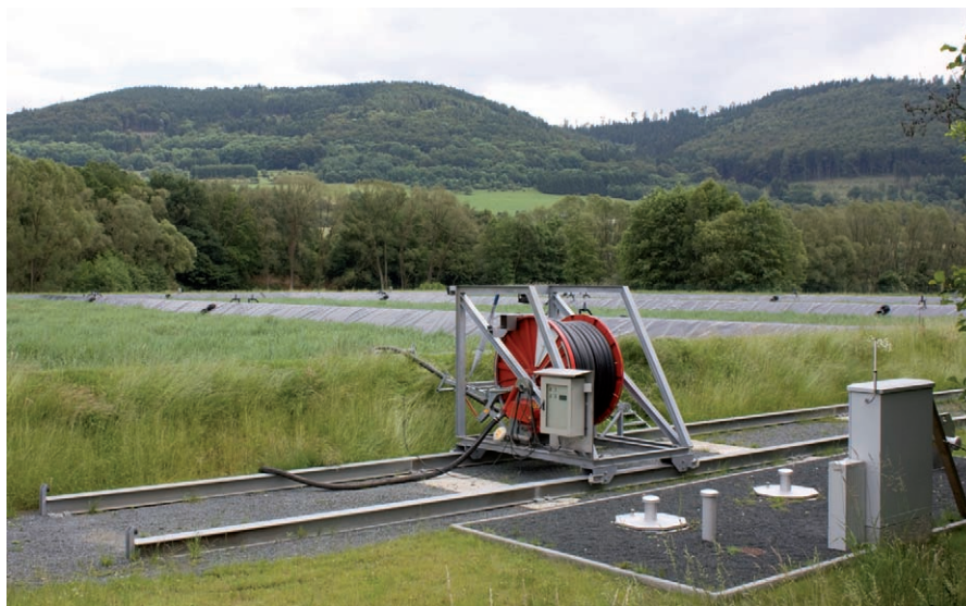
Weltweit einzigartig: Die Kombination aus Computertechnik und Schlauchwagen garantiert die optimale Nutzung der Schilfbeete.