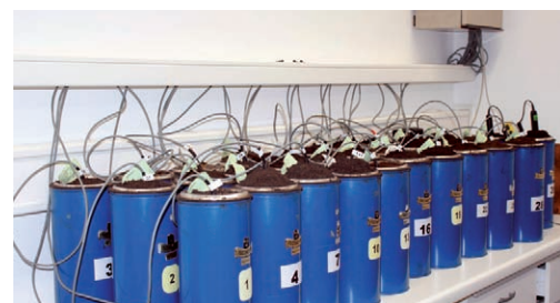
Versuchsaufbau zur Bestimmung des Rottegrads von Komposten